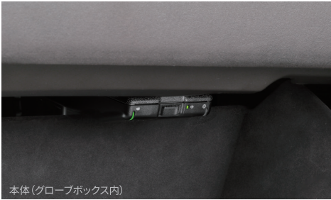
本体(グローブボックス内)