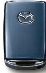
POLYMETAL GRAY METALLIC