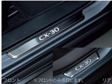
フロント ※フロントのみ点灯します。 リア