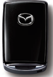
JET BLACK MICA