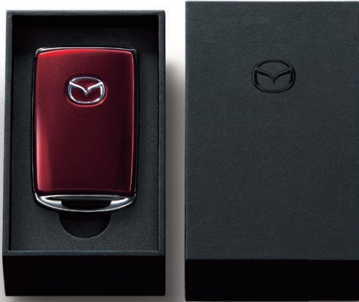
SOULRED CRYSTAL METALLIC

美しさに魅せられる。離れていても愛車を感じる。 手にするたびに深まる愛車との絆。