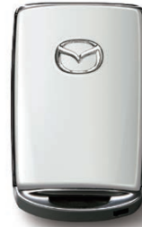
SNOW FLAKE WHITE PEARL MICA