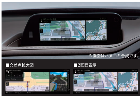
※画面はハメコミ合成です。