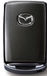
MACHINE GRAY PREMIUM METALLIC