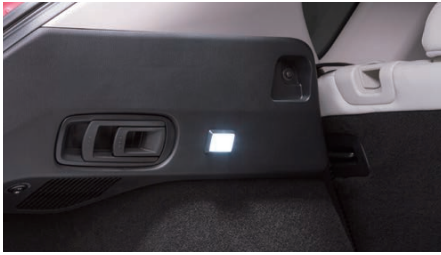
11 LEDラゲッジランプ 3年保証

ラゲッジルームの左右に配置した2ヶ所のLEDランプが、荷物を積む際に影を作らず見えやすくします。リアゲートの開閉に連動して点灯し、不要時はスイッチで消灯することもできます。