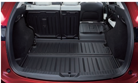
15 ラゲッジトレイ(ハードタイプ) 3年保証

濡れた物や汚れ物でも気にせず置く防水仕様のトレイ。雨具やレジャー用品の収納に便利です。シートバックまで保護し荷室を常に清潔に保つことができます。