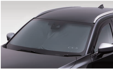
21 サンシェード 3年保証

CX-5専用形状でフロントウィンドにピッタリフィット。素材や色、収納用ソフトケースにもこだわった質感の高いサンシェードです。