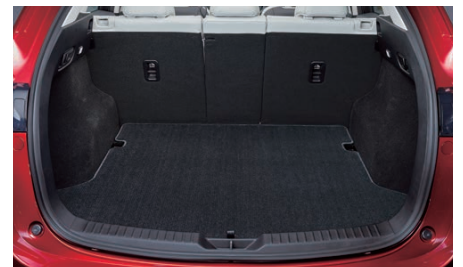
17 ラゲッジマット(カーペットタイプ) 3年保証