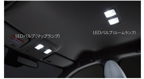
13 LEDバルブ(マップランプ(フロント)) 1年保証

全車(L Package・Exclusive Mode・Silk Beige Selection・BLACK TONE EDITION除く)