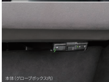
本体(グローブボックス内)