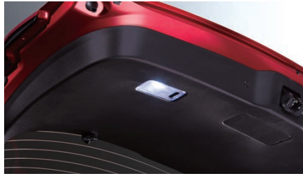
12 LEDバルブ(ラゲッジルームランプ) 1年保証

LEDに替えることで大幅に明るくなります。T10×31タイプ。6000K(ケルビン)。