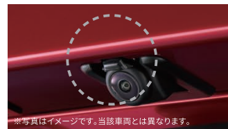
※写真はイメージです。当該車両とは異なります。