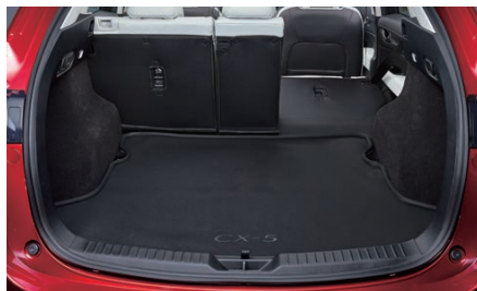
16 ラゲッジトレイ(ソフトタイプ) 3年保証

防水素材を使用しているため水で濡れた荷物も積めるラゲッジトレイ。シート背面に固定して装着できるので、荷物による傷つきや汚れからシートも守ります。