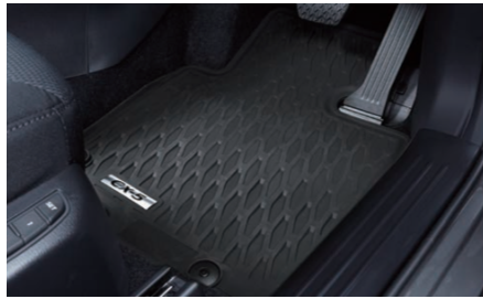
22 オールウェザーマット 3年保証

防水・防汚機能だけでなく、CX-5のデザインにふさわしいシンプルで洗練された造形を追求。品質面だけではなく、車名ロゴが入ったメタルオーナメントで質感の高い仕上げにもこだわっています。運転席・助手席・後席左右の4枚セットです。